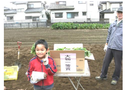
大物賞いただきました