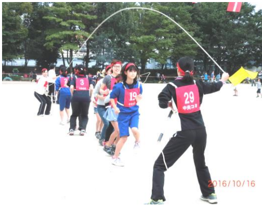
息ぴったり、頑張りました

最後に中央地域コミュニティ体育祭の開催にあたりご助力をいただいた関係者方々に深く感謝、御礼申し上げます。