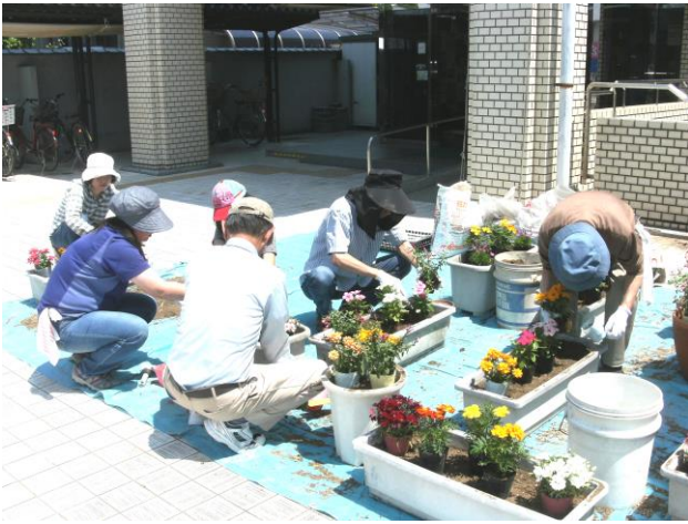
暑い中、がんばりました

土を植えかえようとした時に何か分からないよう虫がいました。わたしは虫がきらいなので大きくてびっくりしました。だいたいよう虫は4匹いました。わたしは、土がすぐきれいなんだなと思いました。土を植え変えたお花が、植え変えていなかった時とくらべてすぐきれいに見えました。楽しい思い出になりました。