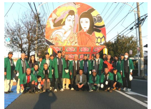
運行前に役員集合