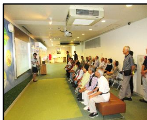
説明を熱心に受ける参加者