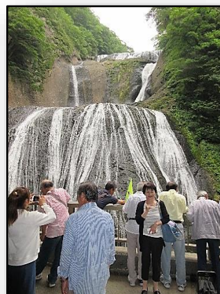
水量一杯の袋田の滝