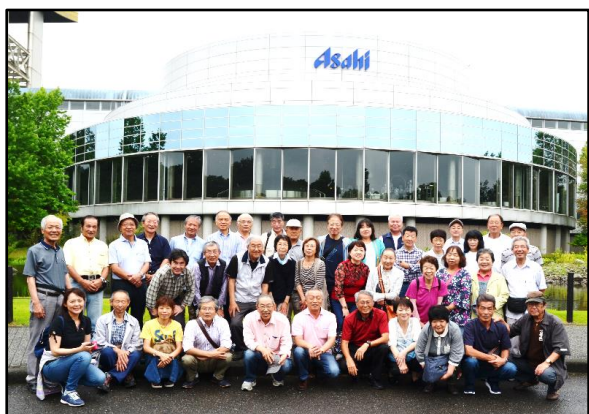
アサヒビール茨城工場にて