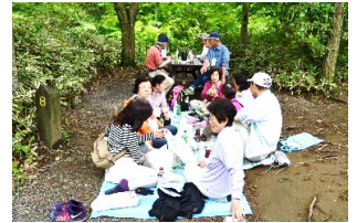
バーベキューで舌鼓