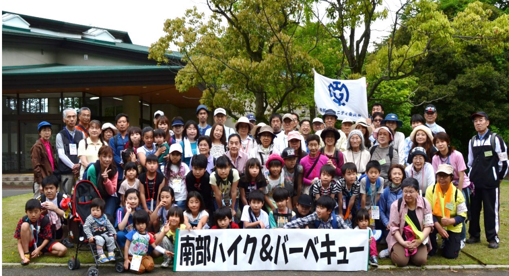
全員集合：自然学習センター前で

第23回南部ハイク&バーベキューが曇り空のした、5月14日(日)163名が参加して行われました。南部公民館を出発して目に染みる「新緑」のなか、お子さんから高齢者まで往復約10Kmを元気に歩きました。野外活動センターでの昼食では役員自慢のバーベキューで腹ごしらえし、子どもたちは輪投げ、缶釣りなどゲームを楽しみました。参加賞と完歩証を受け取り、健康で楽しい一日は無事終わりました。