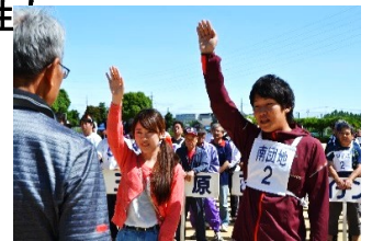
選手宣誓する前年優勝チーム

9チームで熱戦を繰り広げ、好プレー、珍プレーなどもあったが昨年に続き、南団地チームが見事優勝した。青空のもと、皆さん大いに楽しみ、親睦を図ることが出来ました。