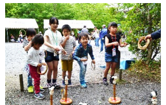
輪投げを楽しむ子ども