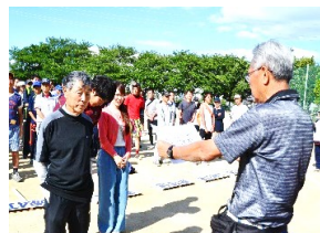
鈴木会長より：表彰状授与