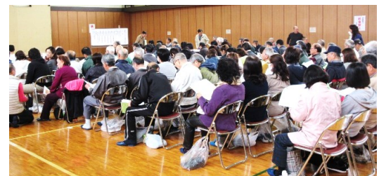
審議中の会場と参加者