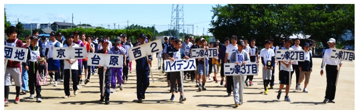
プラカードを手に選手入場