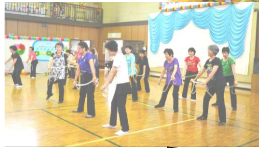
今回は、「R・Y・U・S・E・I」でノリノリ♡♡