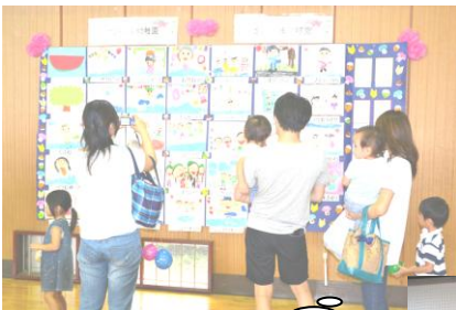
どの作品も未来を感じますね(*^^)v