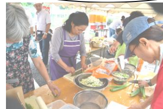
焼きそばも かき氷も 美味じゃ☆