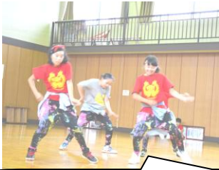
この躍動感!!すばらしい