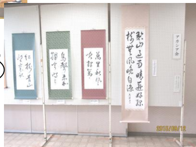
サークル会員さんの作品です。 素敵な作品ばかりですね。