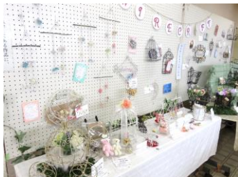
1 創作体験できました