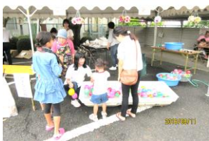
2 行列も..人気の売店です