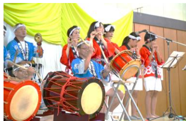
2 南部囃子連、初参加