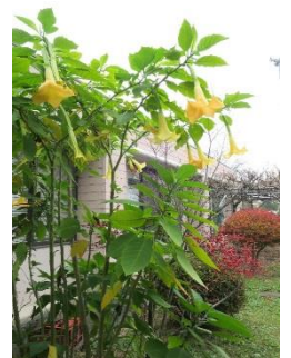
中丸公民館 (エンジェルストランペット)

http://kitamoto-community.or.jp/publics/index/20/