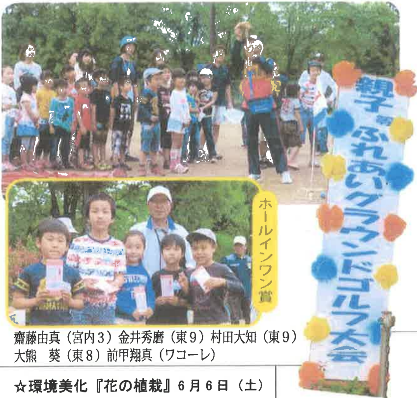
ホールインワン賞

ホールインワンゲームを別に実施し、多くの皆さんが賞品を獲得し、楽しい一日でした。父兄及び役員の皆様お疲れ様でした。